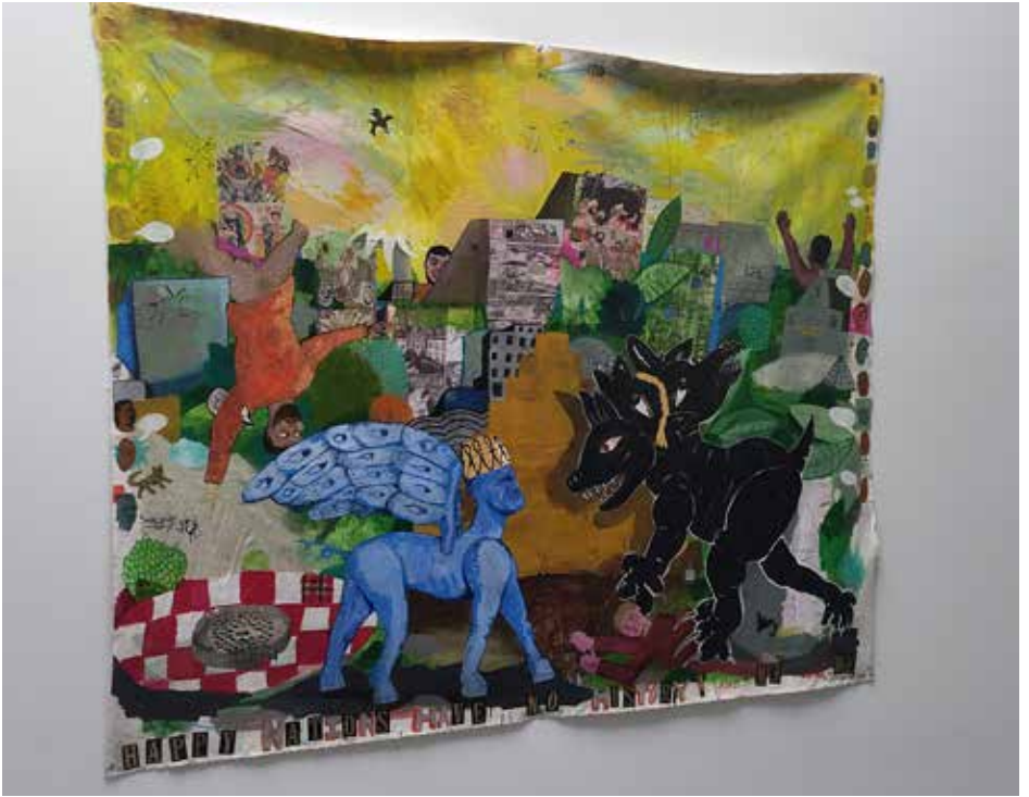
Jenkins Johnson Gallery