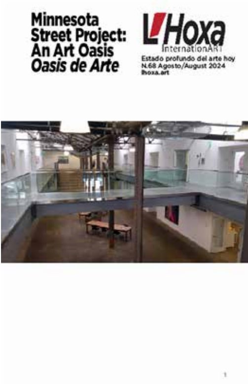
Minnesota Street Project: An Art Oasis / Oasis de Arte

Graphic Design LFQ Follow us on the web archive: lhoxa.art All rights reserved