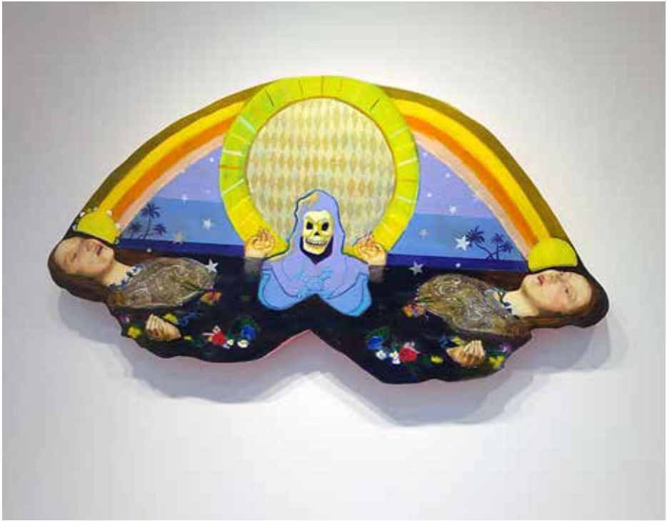
re.riddle re.riddle re.riddle