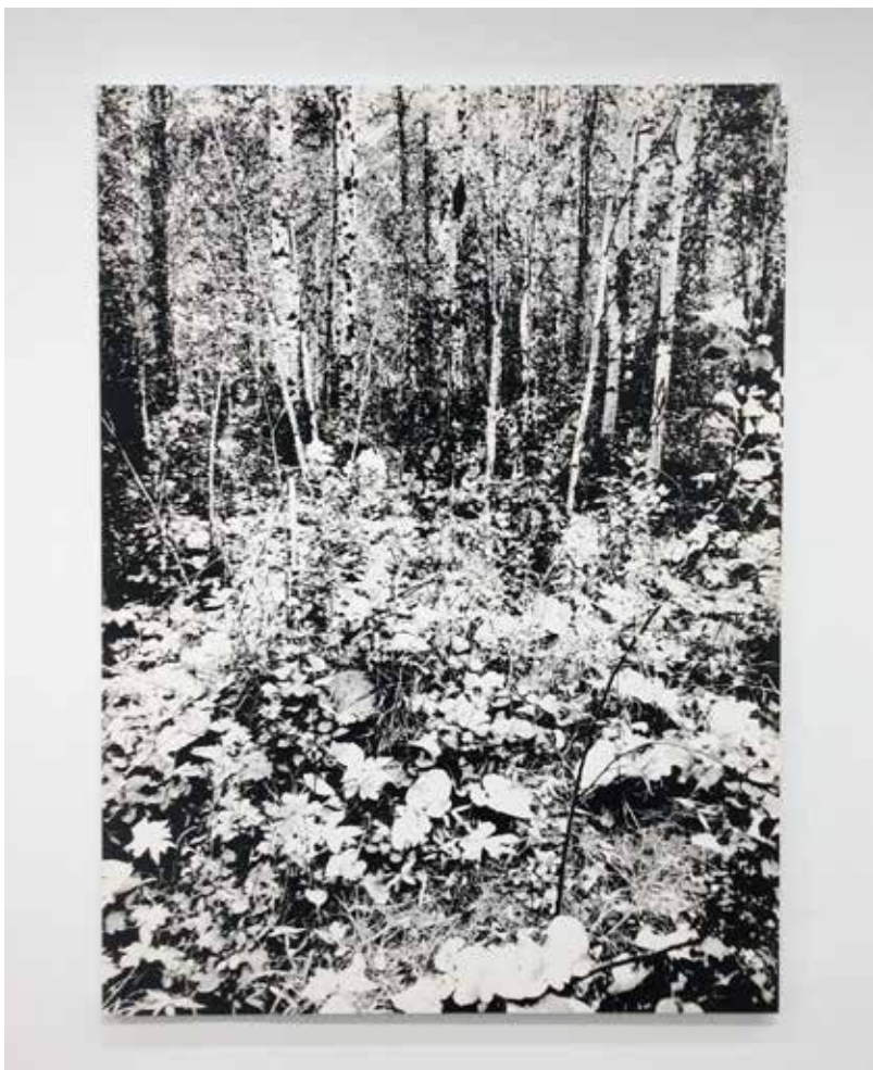
Eleanor Harwood Gallery (2)