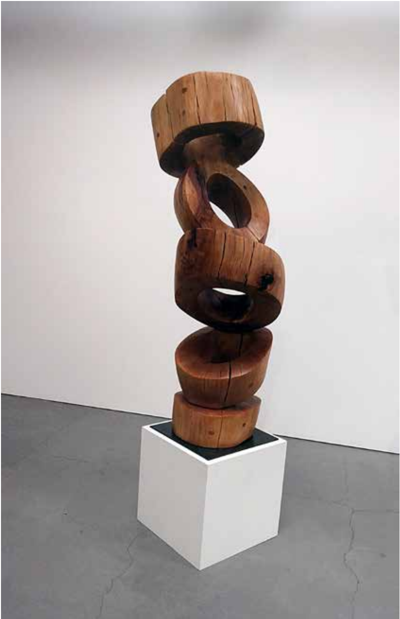
Rena Bransten Gallery