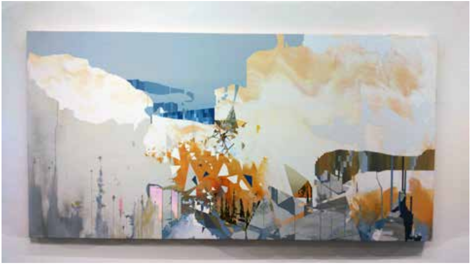
Eleanor Harwood Gallery (3)