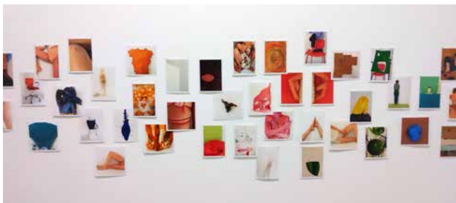
Eleanor Harwood Gallery