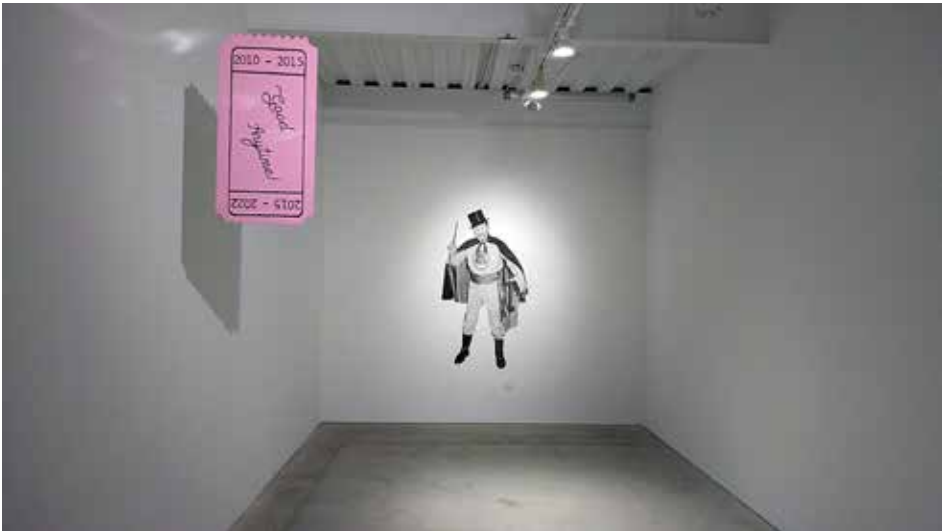
Casemore Gallery (2)