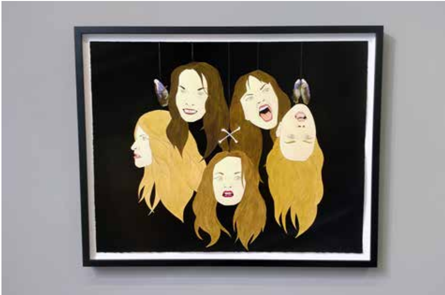
Rena Bransten Gallery (2)