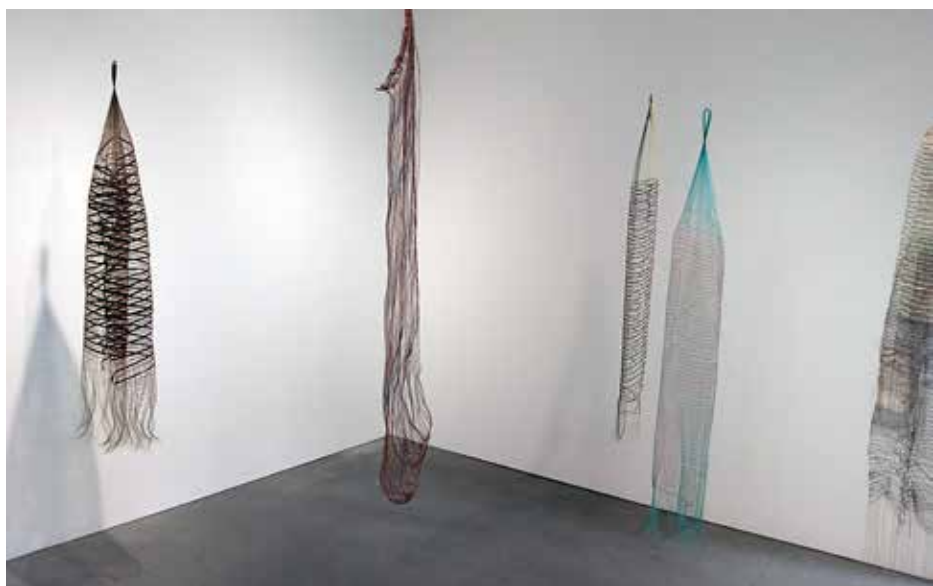
Municipal Bonds (2)