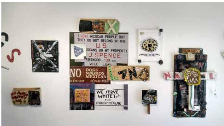
Bass & Riener