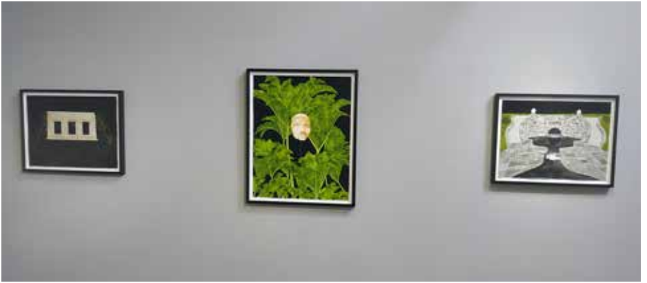
Rena Bransten Gallery (3)