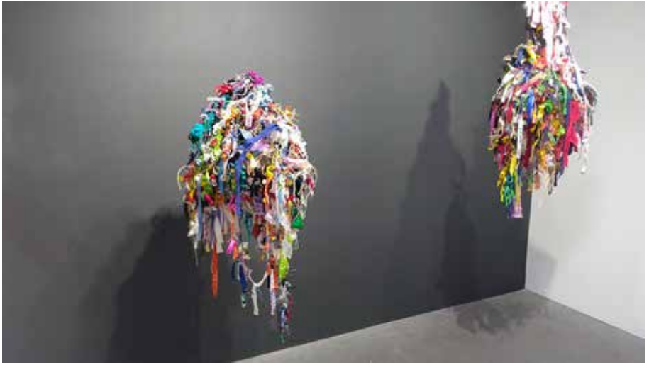
Jack Fisher Gallery