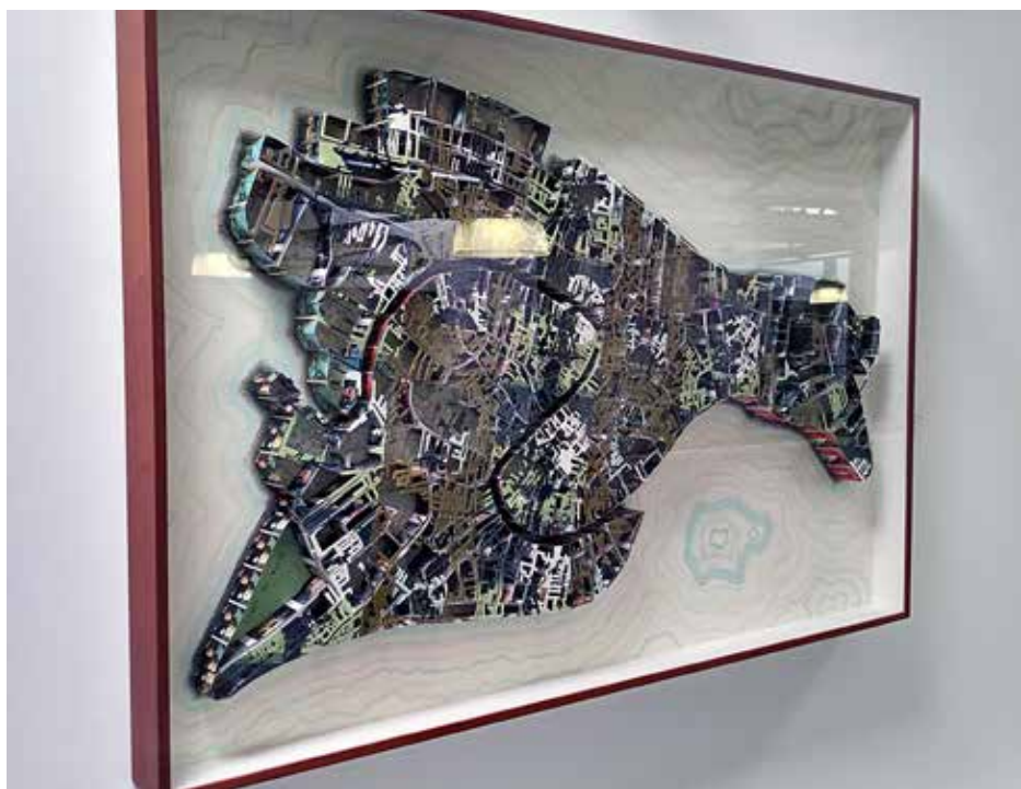
Nancy Toomey Fine Art (2)